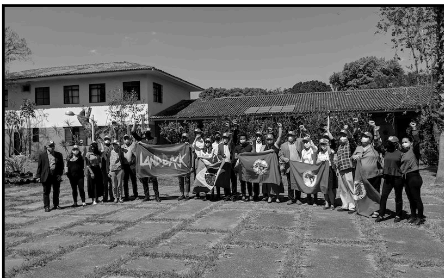
DELEGAÇÃO, BRASIL, 2021

Desde su lanzamiento, el Observatorio ha movilizado delegaciones a más de 10 países de América Latina, Europa y Oriente Medio para realizar observación electoral y defender procesos democráticos libres, justos y transparentes.