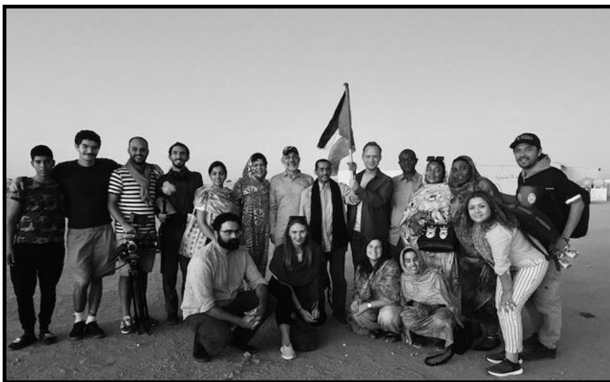
DELEGAÇÃO DA INTERNACIONAL PROGRESSISTA

Dos años antes el pueblo saharaui formó un movimiento de liberación nacional llamado Frente Popular de Liberación de Saguía el Hamra y Río de Oro, o Frente Polisario. Creado para resistir al colonialismo español, el Frente Polisario se encontró ahora en guerra con dos países vecinos. Tras un largo periodo de lucha armada, forzó la salida de Mauritania en 1979. Pero Marruecos sigue ocupando en la actualidad alrededor del 80 por ciento del territorio del Sáhara Occidental. El resto está en manos de la República Árabe Saharaui Democrática (RASD), administrada por el Frente Polisario.