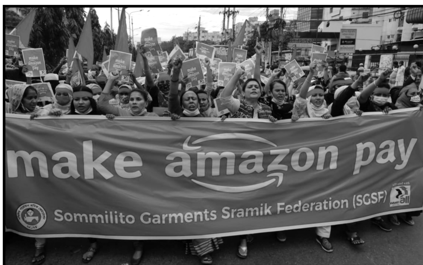
SOMMILITO GARMENT SRAMIK FEDERATION

Estas Demandas Comunes fueron firmadas por más de 25.000 personas sólo en la primera semana, recaudando más de 30.000 dólares en apoyo de los trabajadores de primera línea, y una semana después, la Internacional Progresista anunció la formación de una nueva alianza legislativa que llevaría adelante las demandas de este movimiento: más de 400 diputados de 34 países de seis continentes se comprometieron a llevar las Demandas Comunes del movimiento a sus legislaturas.