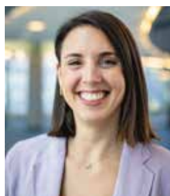
-IRENE MONTERO Eurodiputada de Podemos – España

“ Un golpe de Estado se inicia en Colombia: la guerra sucia judicial rompe las reglas del Estado de Derecho para derribar a un Gobierno del pueblo, referencia de paz y Derechos Humanos. Con ustedes, Presidente. Hagamos que la democracia sea más fuerte que los reaccionarios ”