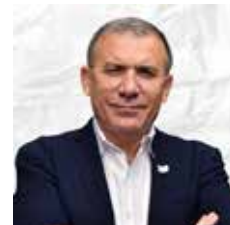
-ROY BARRERAS Embajador de Colombia en Londres

“ La actuación del CNE no solo es inconstitucional sino algo peor: ¡Es políticamente un error enorme! Saben ellos que no tienen competencia y que su anuncio incendiario no puede tener ningún efecto contra el presidente, cuyo fuero lo protege y, sin embargo, hacen un show que alimenta reacciones, pone en riesgo la democracia y desata indeseables consecuencias. Señores del CNE: Corrijan inmediatamente su equívoco e irresponsable comunicado. Es su obligación para con la democracia declarar inequívocamente que NO pueden investigar a la persona del Presidente de la República. La única instancia que puede hacerlo es la Comisión de Acusaciones ”