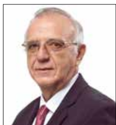
-IVÁN VELÁSQUEZ Ministro de Defensa

“ El fuero presidencial es integral. Ninguna autoridad diferente al Congreso puede investigar a un Presidente de la República en ejercicio ”