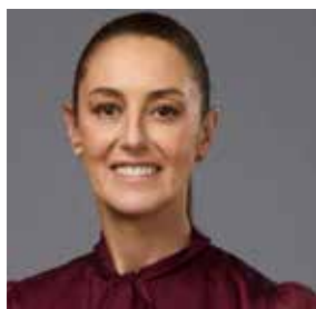
-CLAUDIA SHEINBAUM Presidenta de México

“ Nuestra solidaridad con el Presidente Petro. El Consejo Nacional Electoral de Colombia, dos años después de la elección, abre una investigación por gastos de campaña. El Presidente Petro lo llama un golpe de estado... Nuestra solidaridad con el presidente Petro. Como ustedes saben, él es el único presidente progresista que ha tenido Colombia y siempre nuestro apoyo, nuestra solidaridad. Cuando haya siempre una injusticia, es parte de nuestra política ”